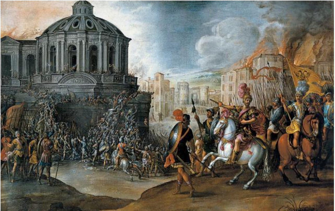
Il sacco di Roma (1527) – Il 6 maggio 1527 i Lanzichenecci, truppe mercenarie tedesche al servizio di Carlo V d'Asburgo, saccheggiano Roma; alcuni considerano questa data la fine del Rinascimento.