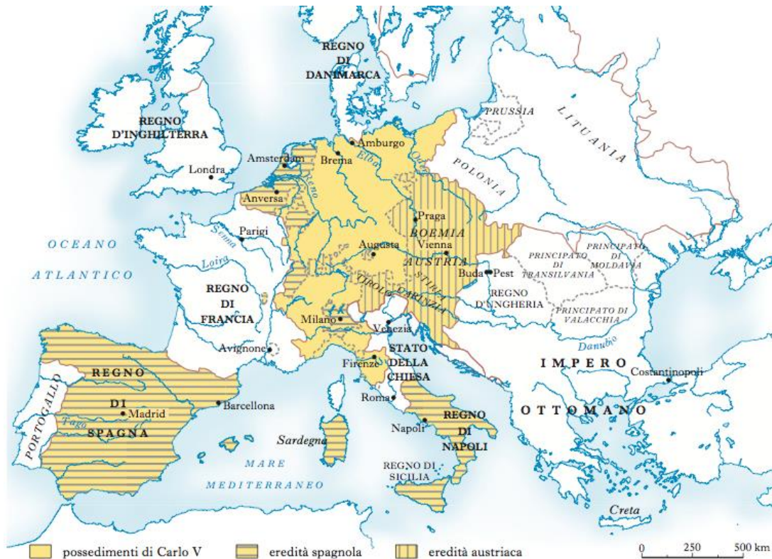
I domini di Carlo V in Europa