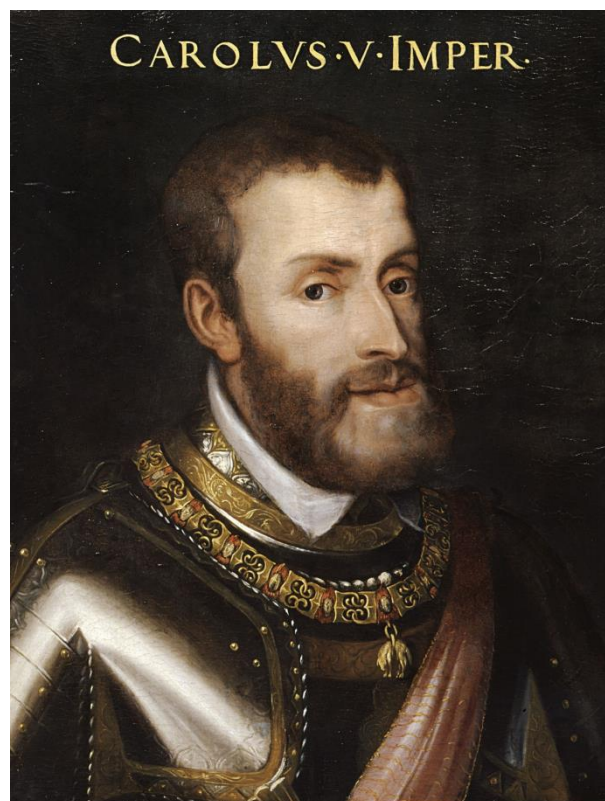
Carlo V d'Asburgo, re di Spagna e imperatore del Sacro Romano Impero