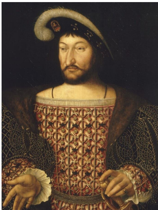
Francesco I di Francia