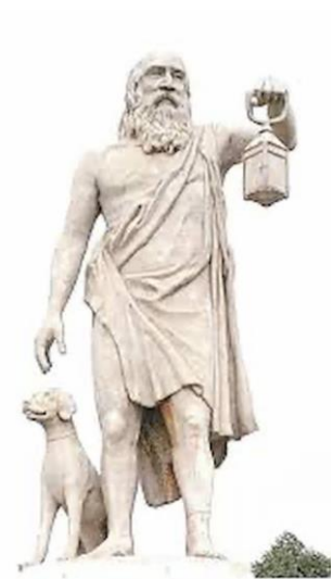
Due immagini di Diogene il cinico.

2/ La scuola megarica – Il nome viene dalla città di Megara, in Grecia. I megarici operavano una fusione del pensiero di Socrate e di Parmenide : Euclide di Megara riteneva che il bene è uno solo (cfr. Socrate che identificava il bene con la scienza) ed è l'Essere di cui parlava Parmenide. I megarici ripresero lo studio della dialettica nella stessa direzione di Zenone per dimostrare la tesi dell'assoluta unità ed unicità dell'essere.